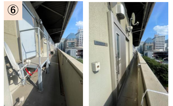
⑥【関係者通路】3Fの諸室間を通る動線は狭い