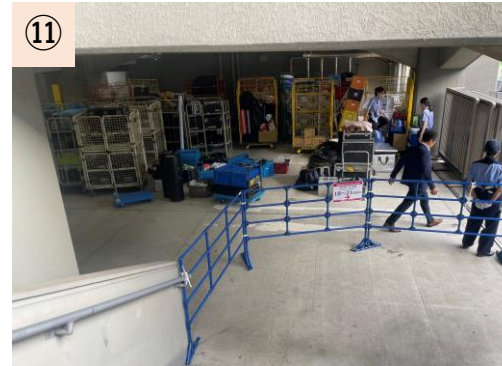
⑪【観客・選手動線とバックヤード】 資材置き場が不足し、動線から見える状態