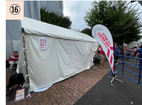
⑰【観客救護所】 諸室が少ないため外構テントで対応せざるを得ない