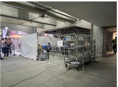
⑯【スタッフ控室】 諸室が少ないため、バックヤードスペースや屋外にテントを立てて休憩所として運用