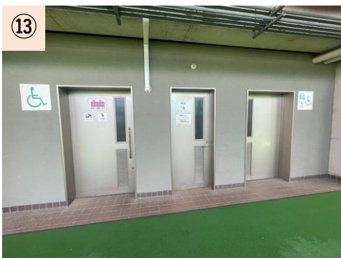
⑬【授乳室】 北側コンコースに1室しかないため、利用しにくい