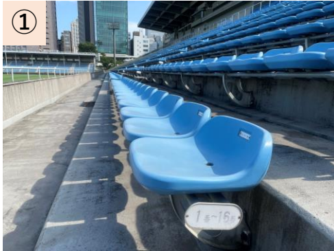
①【メインスタンド】全座席カップホルダーがなく、1席あたりも狭い