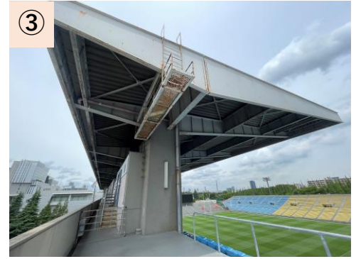
③【メインスタンド】排水管の錆びによる水漏れ（修繕済）