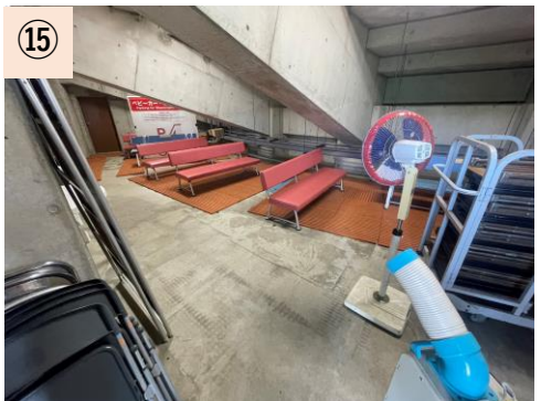
⑮【スタッフ控室】 控室が少ないため、倉庫を休憩所とせざるを得ない