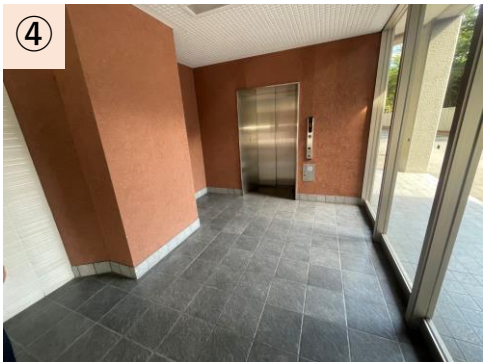
④【エレベーター】VIP・放送関係者・チーム関係者が共用するため運用しにくい