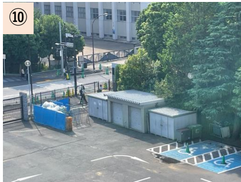
⑩【ゴミ集積場所】 駐車場に常設されているが、イベント時は一時集積・分別する場所がないため、一時的に観客動線上に集積場所を作らざるを得ない