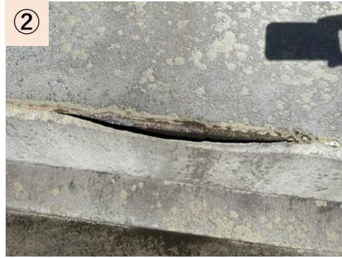
②【メインスタンド】段床部分が劣化し亀裂が発生（修繕済）