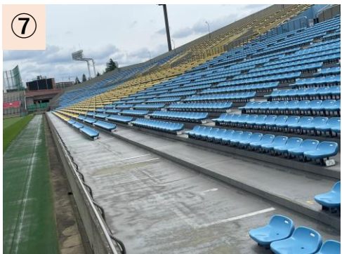
⑦【バックスタンド】車椅子スペースの不足