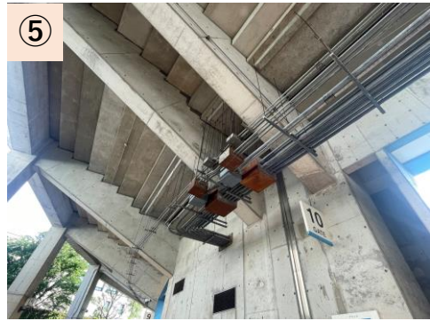
⑤【コンコース】老朽化による漏水や腐食が目立つ