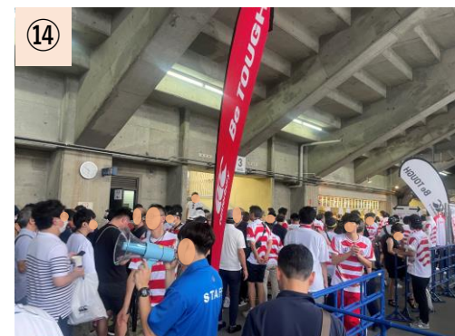
⑭【コンコース】 大規模イベント時、トイレ・売店・グッズ売店の待機列が交錯してしまう