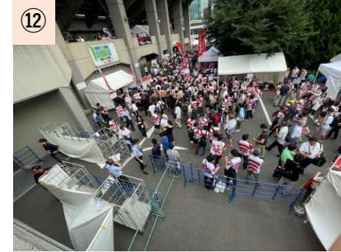
⑫【正面玄関横】 観客動線から選手等関係者入り口が見える状態