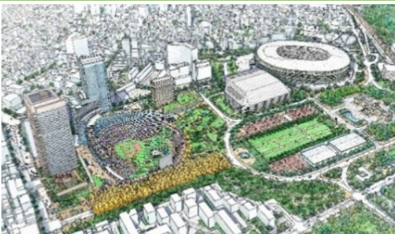
東側から計画地を望むイメージパース