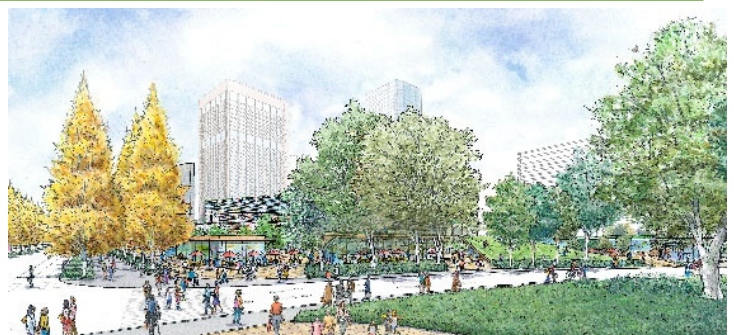
中央広場整備イメージパース